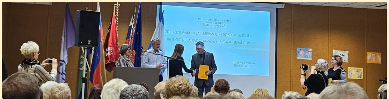
Fotografirala Evina mama.

Prvič sem bila na takšni prireditvi. Počutila sem se super, ko so poklicali moje ime za nagrado/priznanje. Ker sem v pesem vložila veliko truda, sem bila presrečna.