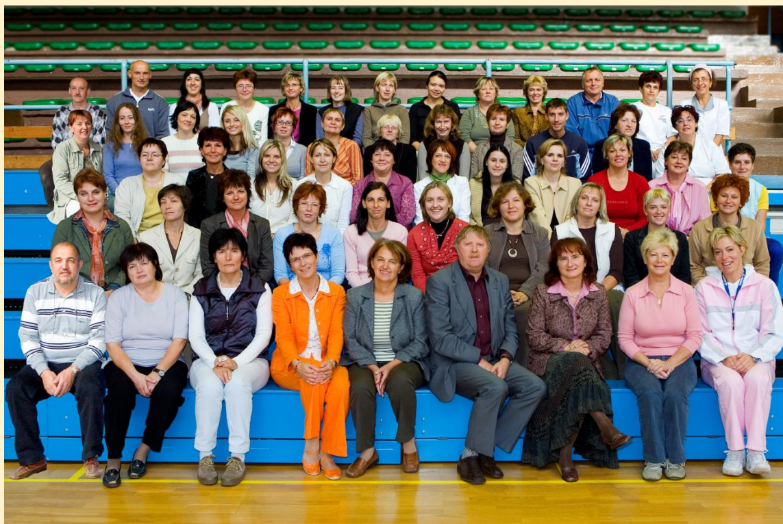
Fotografija zaposlenih v šolskem letu 2006/2007