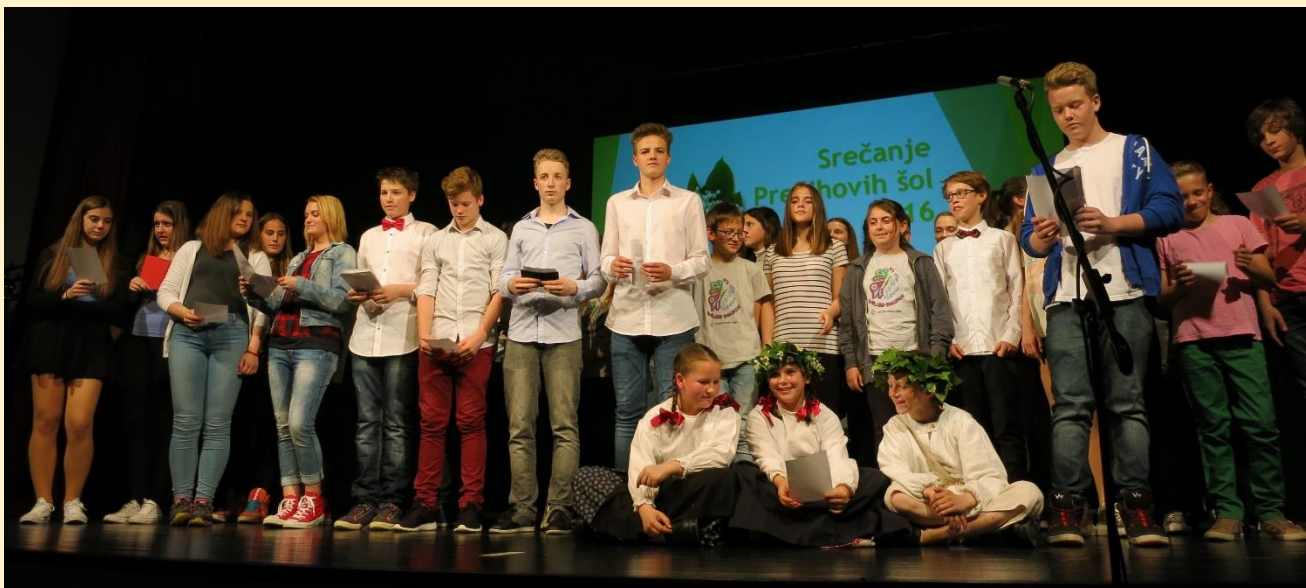
38. srečanje Prežihovih šol na Ravnah 2016

Izšlo je glasilo, vezano na naš kraj, na naše mesto. Najdete ga lahko na spletnih straneh šole ( http://voranc.splet.arnes.si/files/2020/01/SAMORASTNIK-ob-38.-sre%C4%8Danju-Pre%C5%BEihovih-%C5%A1ol-2016.pdf ).