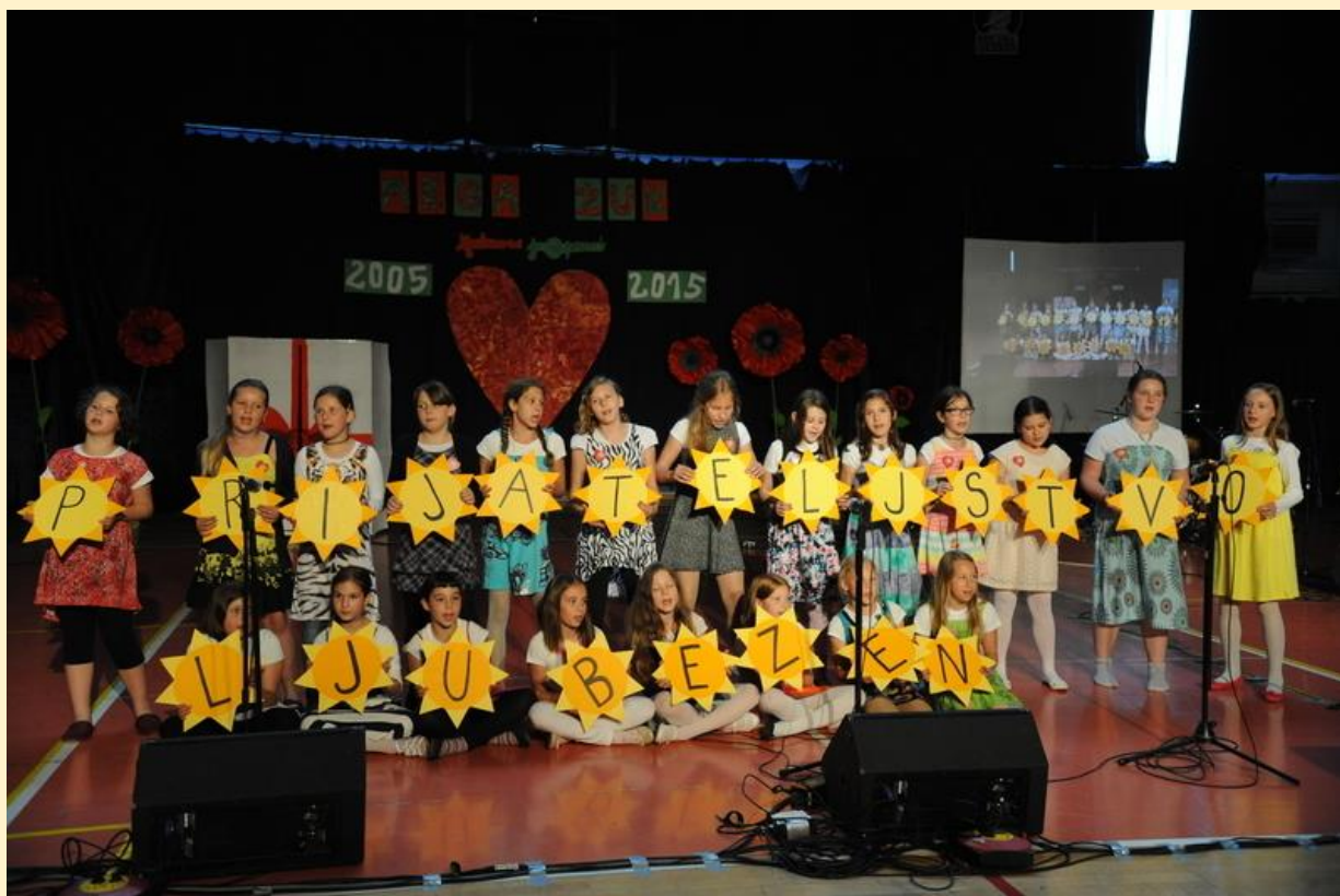
2016 izid knjige POKLON NAŠI ŠOLI ob 50-letnici šole in prireditiv.