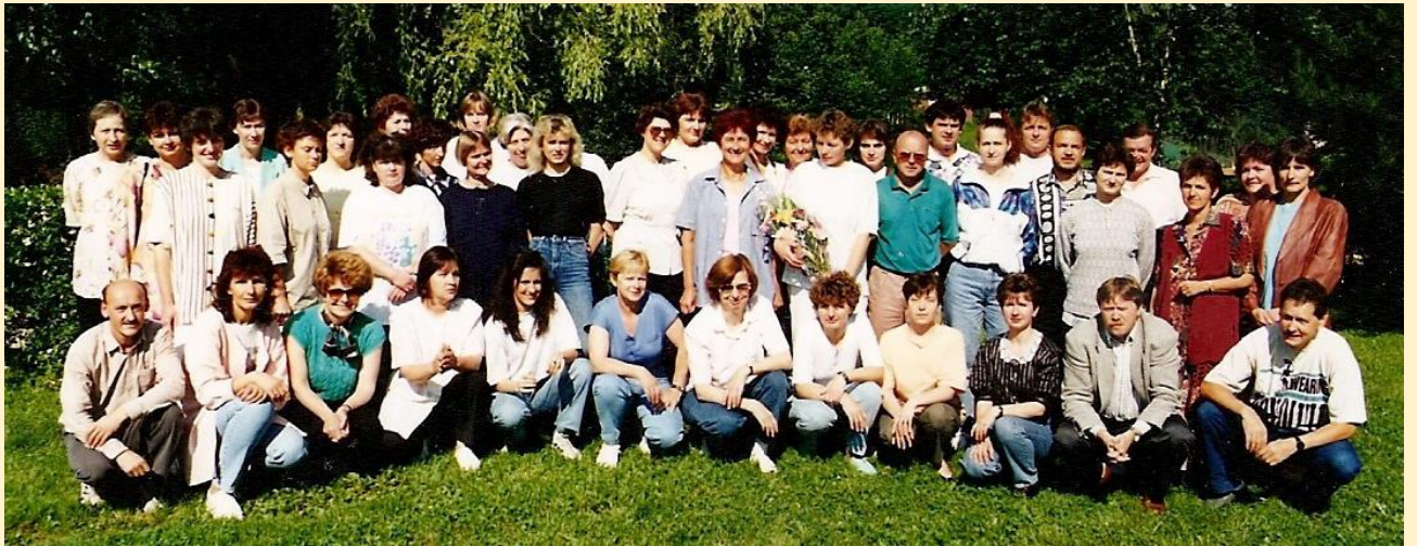
Učiteljski zbor leta 1995

21. 3. 1997 smo dočakali odprtje novega dela šole. Ob tej priložnosti je izšla knjiga Pregled zgodovine osnovnega šolstva na Ravnah na Koroškem .