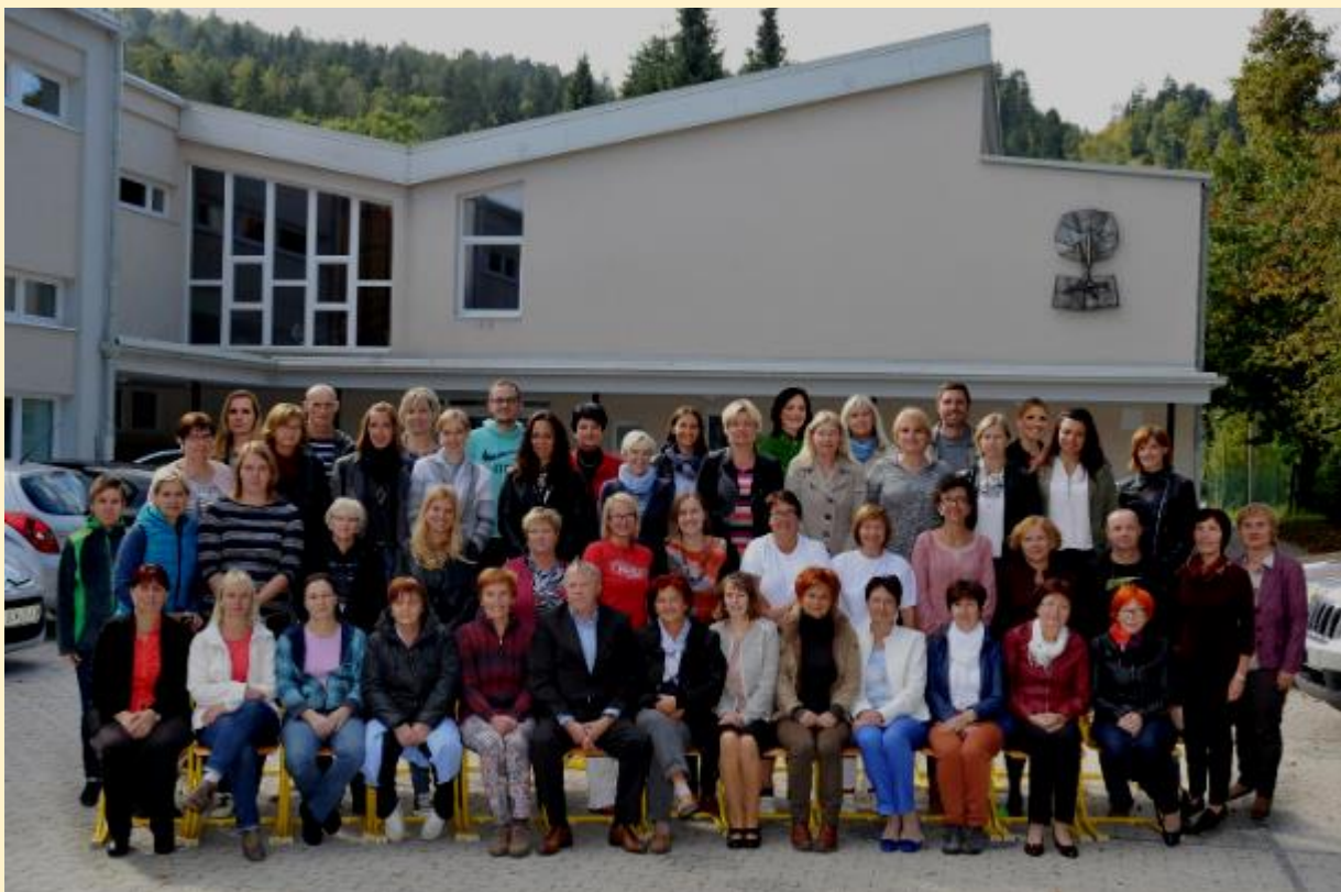
Kolektiv vseh zaposlenih leta 2016

Izšlo je glasilo, vezano na naš kraj, na naše mesto. Najdete ga lahko na spletnih straneh šole ( http://voranc.splet.arnes.si/files/2020/01/SAMORASTNIK-ob-38.-sre%C4%8Danju-Pre%C5%BEihovih-%C5%A1ol-2016.pdf ).