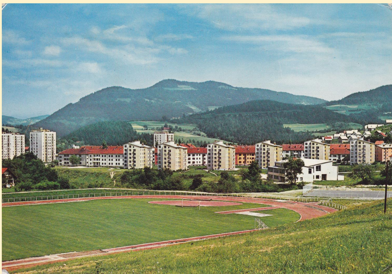
OŠ Prežihovega Voranca na razglednici iz leta 1972

Ker se naša šola imenuje po koroškem pisatelju, Lovru Kuharju - Prežihovem Vorancu, si rečemo prežihovci. Že OŠ RAVNE I je vzpostavila sodelovanje z vrstniki z OŠ II Ravne na Koroškem in z OŠ Prežihovega Voranca iz Maribora. To je bil začetek projekta Srečanje šol s Prežihovim imenom , ki traja še danes. Od leta 1970 potekajo srečanja šol (5 jih imamo v Sloveniji, 2 sta od 1983 v Italiji v drugi polovici maja).