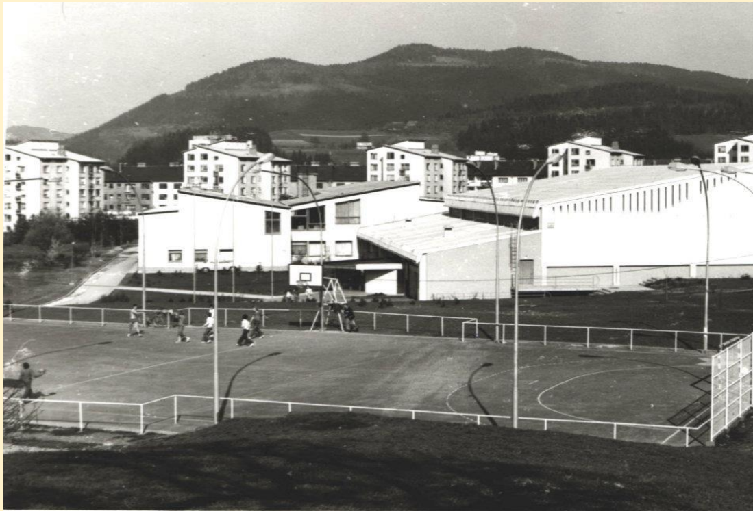
Leta 1976 smo dobili telovadnico.

Začnejo uresničevati projekt gradnje nove osnovne šole na Javorniku. V šolskem letu 1978/79 pride do razdružitve šol. Ravne imajo odslej OŠ Koroški jeklarji s podružnico Kotlje in OŠ Prežihovega Voranca s podružnico Strojna.