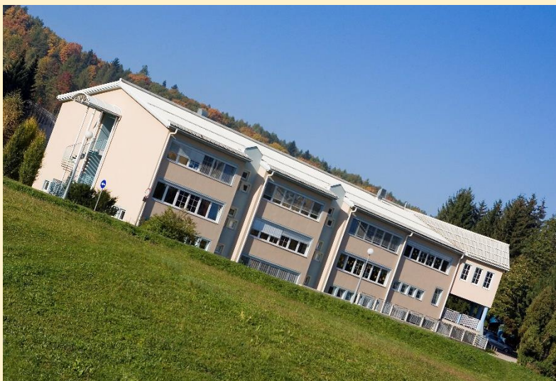
Septembra 2000 smo vstopili v devetletko.