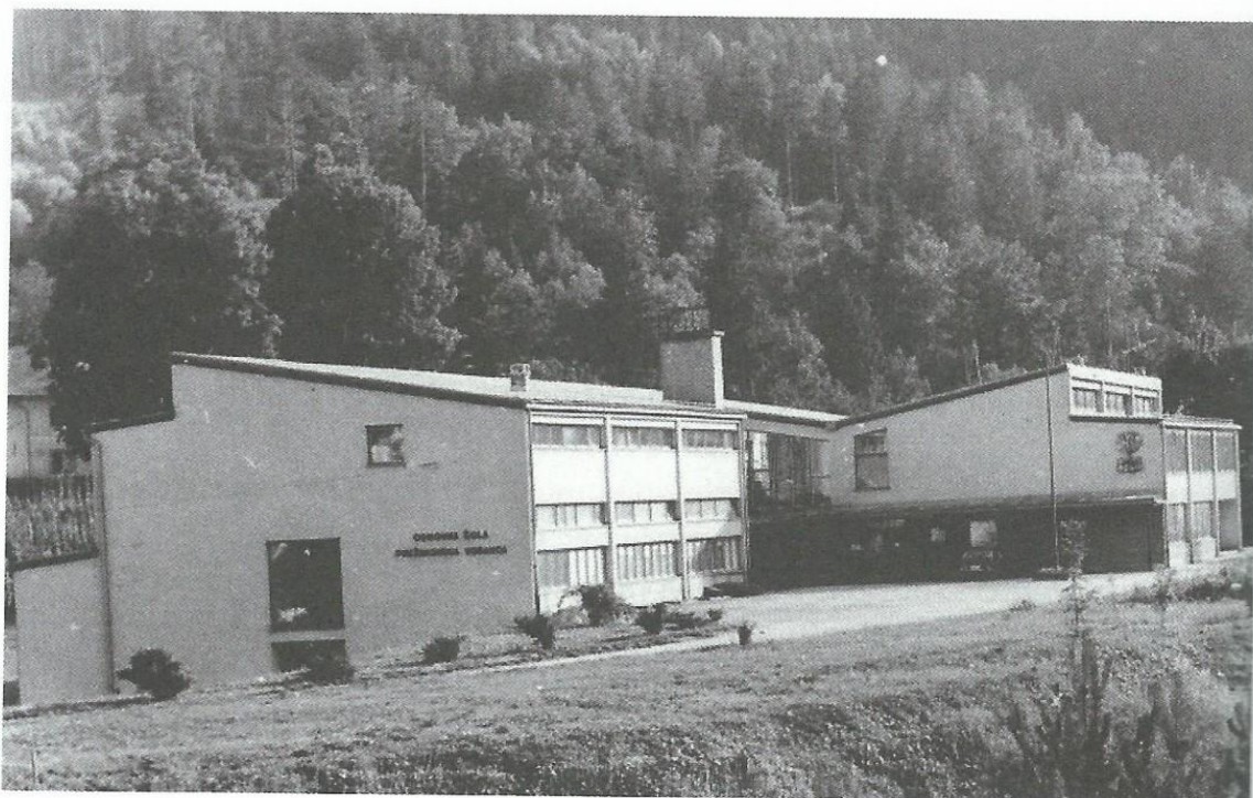
Novo poslopje OŠ Prežihovega Voranca Ravne na Koroškem, katerega otvoritev je bila 27. 11. 1966

V šolskem letu 1964/65 sta bili na Ravnah dve osnovni šoli (Osnovna šola Prežihovega Voranca in Osnovna šola Ivana Ditingerja), ki sta delovali na petih lokacijah, pouk je potekal v izmenah. Zato so začeli graditi novo šolsko poslopje. 1. avgusta 1966 sta se obe ravenski šoli združili pod imenom Osnovna šola Ravne na Koroškem.