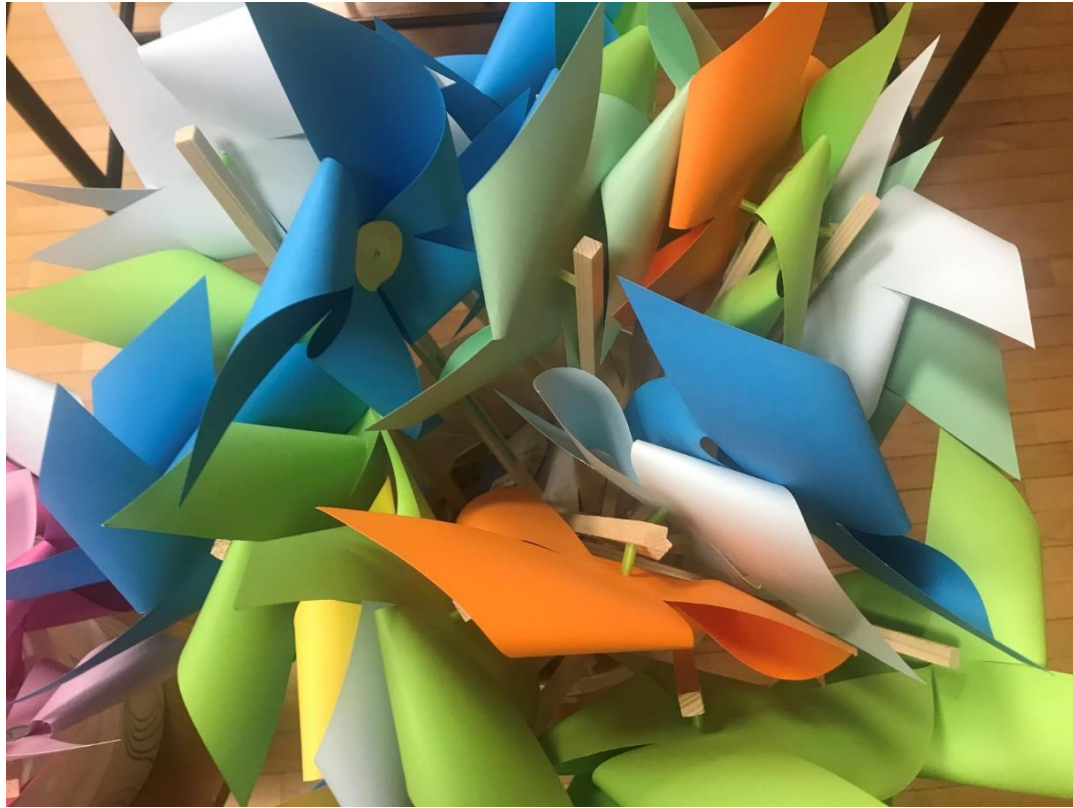
Zapisala Janja Čebulj Februar 2022

Ko so bile gotove, smo bili zelo zadovoljni, saj smo prepričani, da se bodo otroci ob vpisu v 1. razred razveselili našega darila.