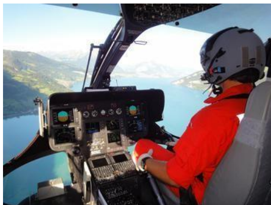
Sistem FLARM nameščen v helikopterju

Jadralno letenje je lep, a tudi nevaren šport. Namen raziskave je dokazati smiselnost uporabe sodobnih inštrumentov in naprav, vgrajenih v jadralna letala, saj ti prispevajo k izboljšanju varnosti letenja in posledično k zmanjšanju števila nesreč in incidentov. S simulacijo primerov v simulatorju letenja »Condor Soaring 2« ter analizo obstoječih zapisov letov v aplikaciji »SeeYou« sem prikazal kritične situacije in pomanjkljivosti vizualnega jadralnega letenja. Med raziskavo ni prišlo do materialne škode ali ogrožanja človeških življenj. V svoji raziskavi sem prišel do ugotovitve, da bi uporaba naprave FLARM lahko preprečila resen incident ali nesrečo. V analitičnem delu sem iz pridobljenih podatkov ugotovil, da se je v določenem časovnem obdobju število nesreč zmanjšalo, kar sovпада s povečano vgradnjo in uporabo FLARM-a v jadralnih letalih.