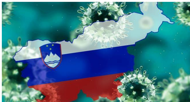
COVID-19 v Sloveniji.

Toliko pozornosti sem namenila raziskovanju, ker sem opazila, da pogosto naše počutje ni enako, kot je bilo pred pojavom COVID-19, in da bi bilo dobro prispevati k raziskovanju posledic epidemije ter mladostnikom predstaviti, da niso edini, ki imajo težave, kam se lahko obrnejo po pomoč in da prošnja po pomoči ni nič sramotnega.