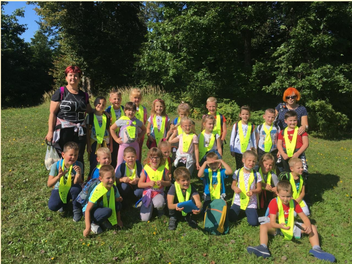
Pripravila: Marija Mirnik, učiteljica