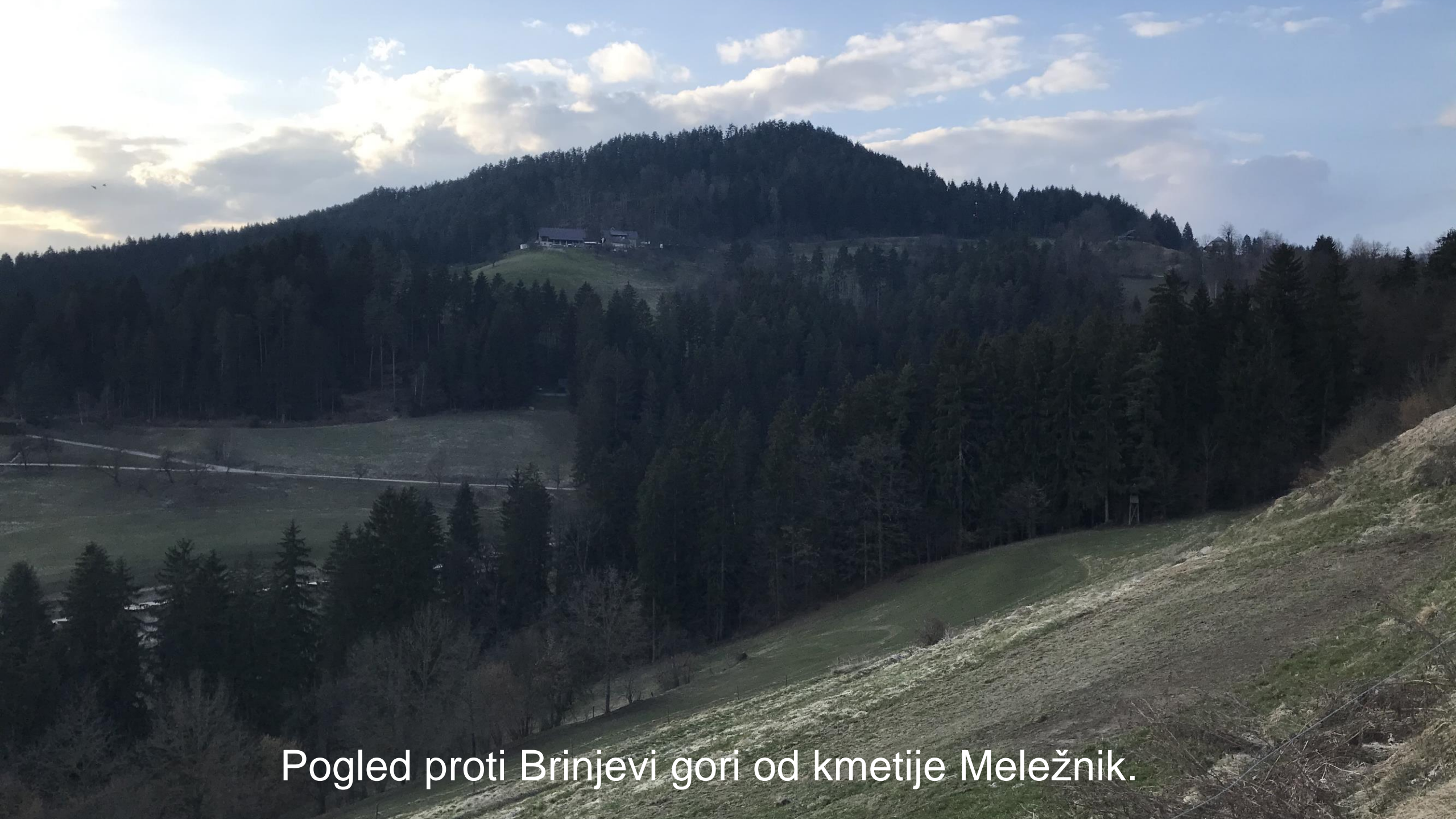
Pogled proti Brinjevi gori od kmetije Meležnik.